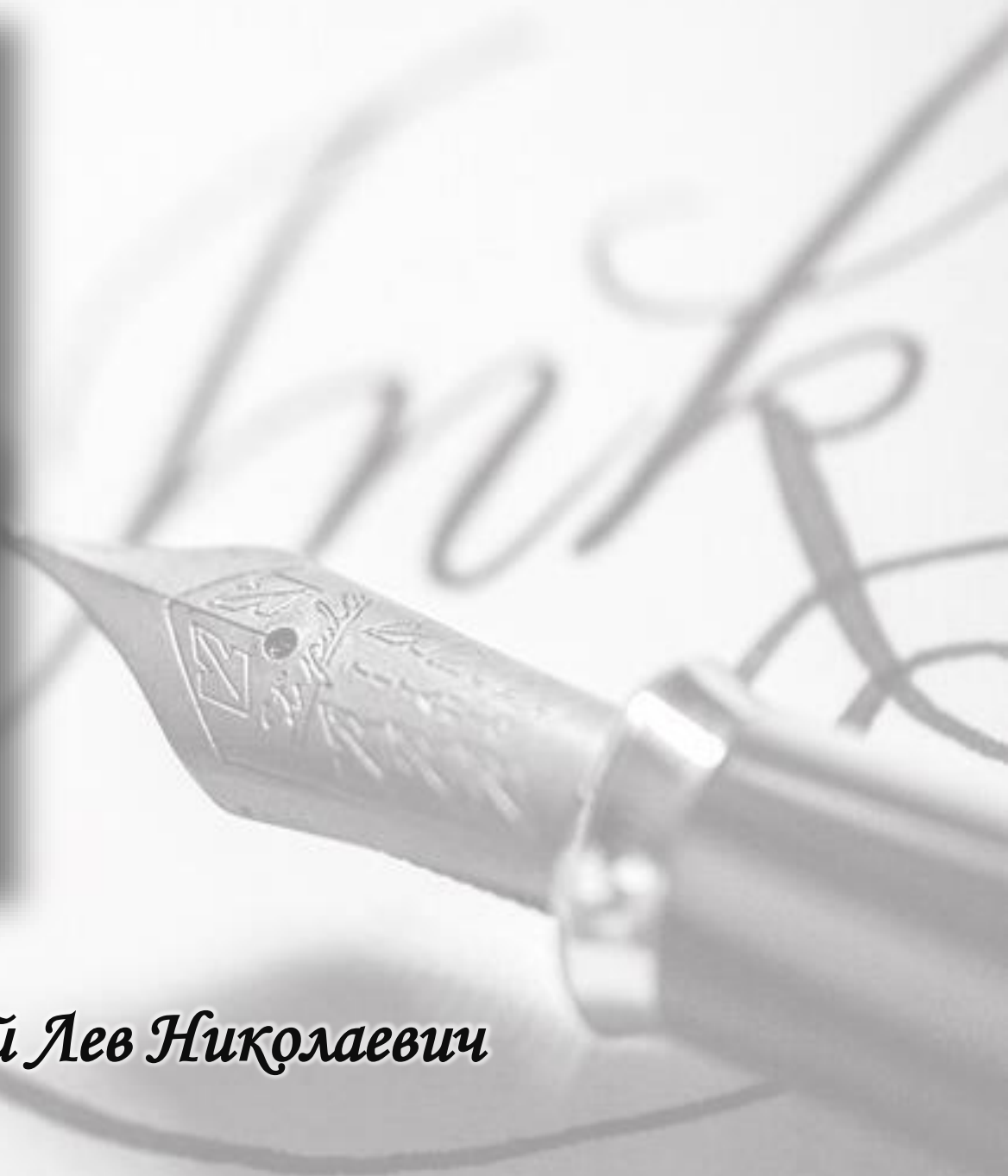
Толстой Лев Николаевич