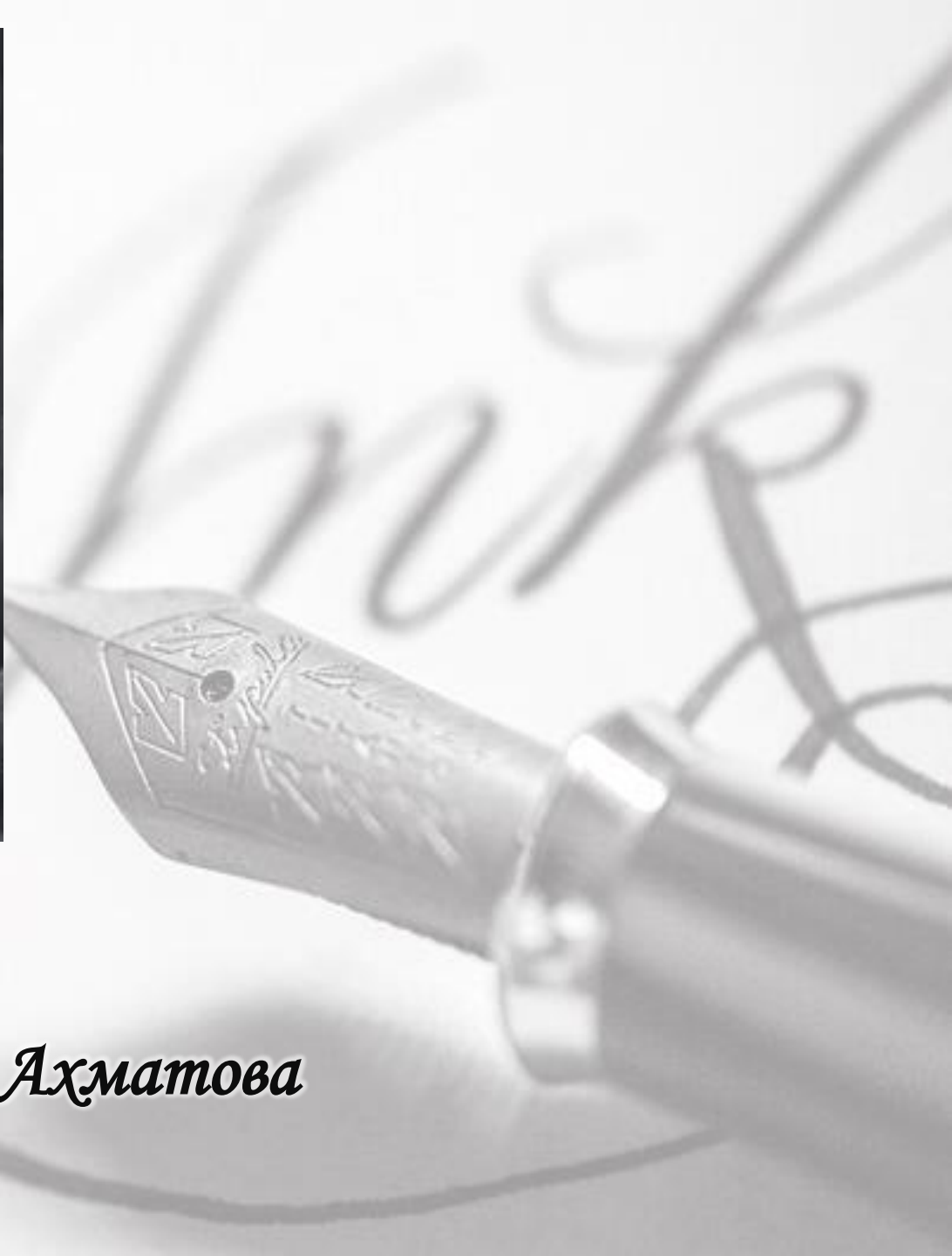
Анна Андреевна Ахматова