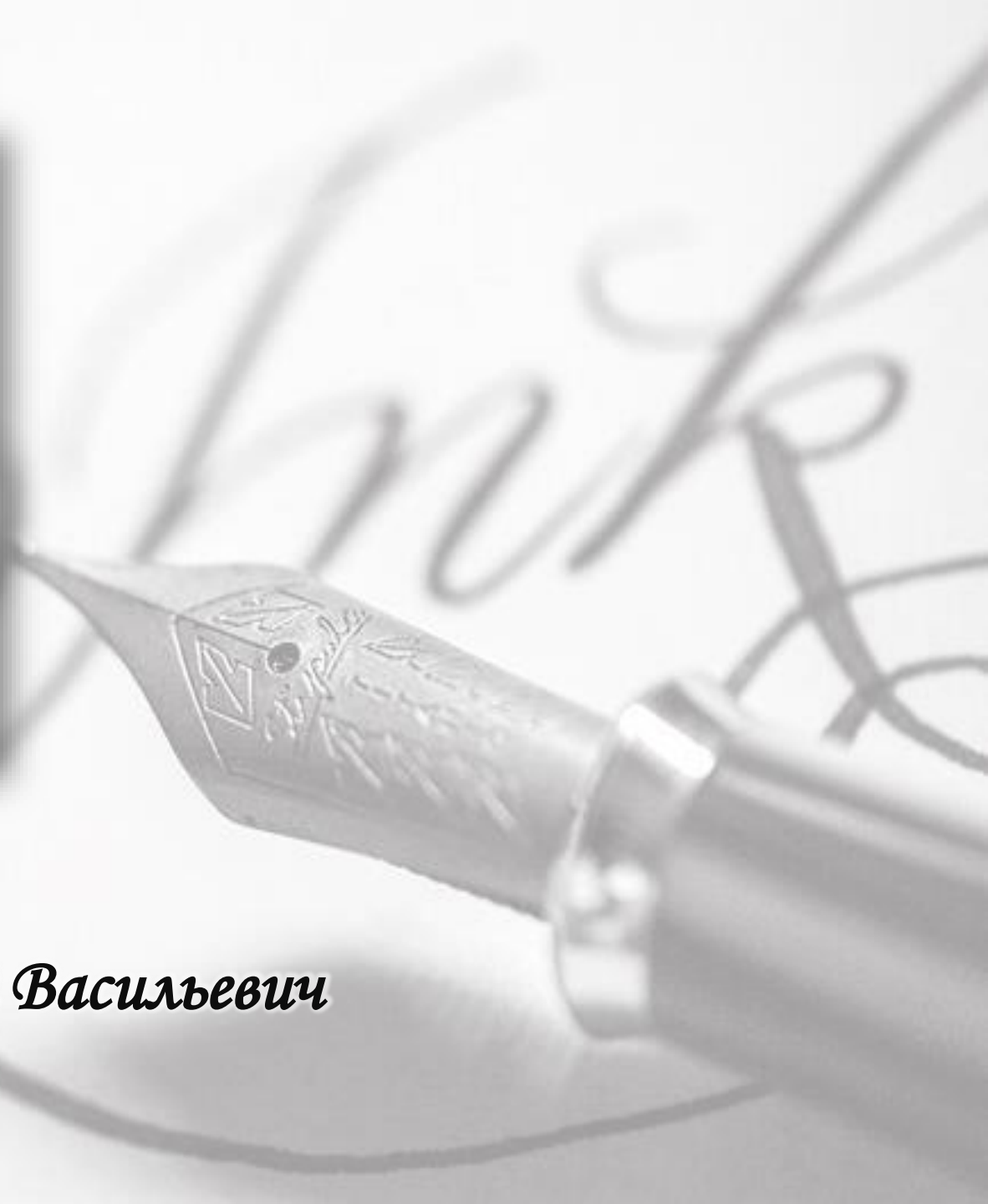
Гоголь Николай Васильевич