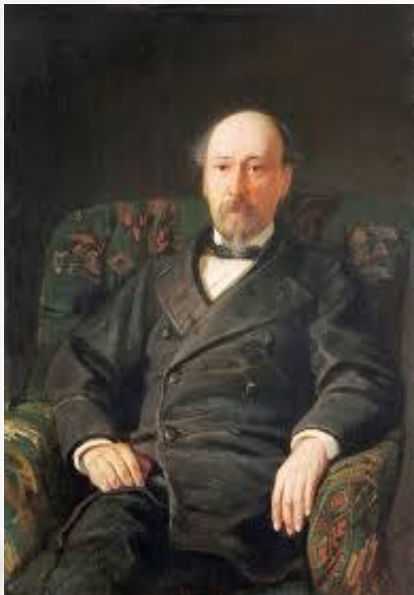
Николай Алексеевич Некрасов