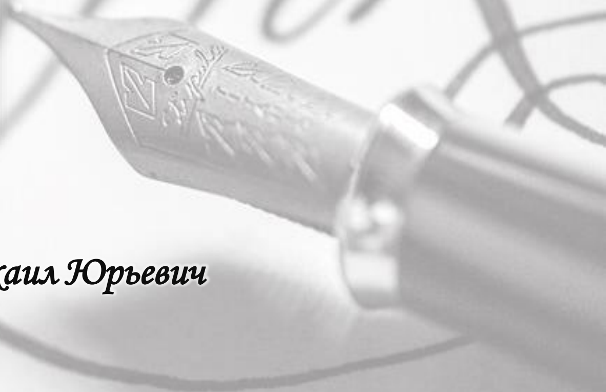
Лермонтов Михаил Юрьевич