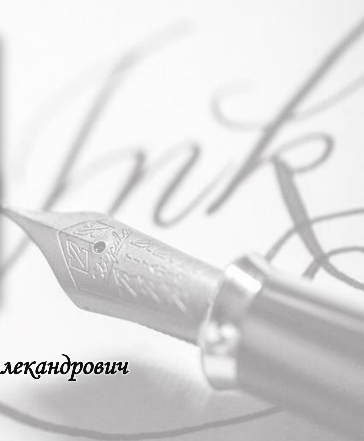
Есенин, Сергей Александрович